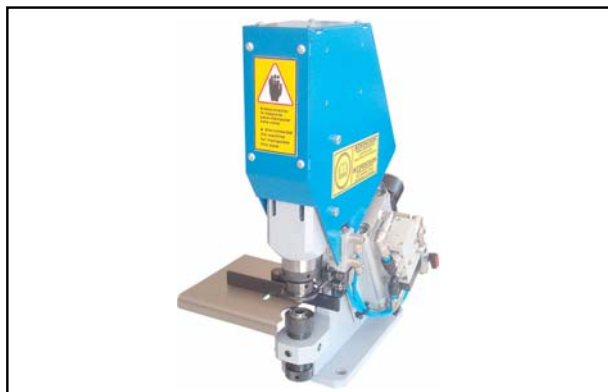
Vorführgerät aus Demoraum Junior - pneumatische Ösenstanze für 12mm Metalllösen, Bj. 2011 Technische Daten ( bitte hier klicken ) Neupreis: € 1.990,- Verkaufspreis: € 1.690,-

Alle unsere Demomaschinen sind technisch überprüft und in einem einwandfreien, neuwertigen Zustand. Die meisten Geräte werden mit der vollen Hersteller-Garantie ausgeliefert (ausgenommen hiervon sind z.B. Verschleißteile wie Haupt- und Zugwalzen sowie Messer und Druckköpfe). Zwischenverkauf vorbehalten. Alle Preise sind in Euro und gelten EXW ab Lager Freiburg, zzgl. der gesetzlichen MwSt. Gerne unterbreiten wir Ihnen ein Angebot für die Anlieferung, Inbetriebnahme und Schulung des Personals.