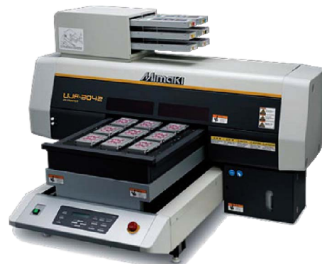
Vorführgerät aus Demoraum MIMAKI UJF 3042, UV A3 Flachbettdrucker Bj. 08/2011 Technische Daten (Details bitte anfragen) Neupreis: € 24.800,- Verkaufspreis: € 19.800,-

Alle unsere Demomaschinen sind technisch überprüft und in einem einwandfreien, neuwertigen Zustand. Die meisten Geräte werden mit der vollen Hersteller-Garantie ausgeliefert (ausgenommen hiervon sind z.B. Verschleißteile wie Haupt- und Zugwalzen sowie Messer und Druckköpfe). Zwischenverkauf vorbehalten. Alle Preise sind in Euro und gelten EXW ab Lager Freiburg, zzgl. der gesetzlichen MwSt. Gerne unterbreiten wir Ihnen ein Angebot für die Anlieferung, Inbetriebnahme und Schulung des Personals.