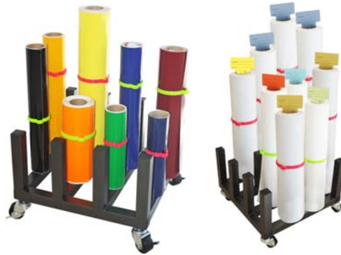
Neugerät Rollenständer für 12 Rollen , fahrbar, für 2" und 3" Kerne Neupreis: € 199,- Rollenständer für 16 Rollen , fahrbar, für 3" Kerne Neupreis: € 249,-