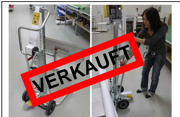
Demogerät aus Demoraum EasyTransport , leichtes rückschonendes Be- und Entladen für bis zu maximal 120 kg Rollen. inkl. Seitenverlängerung, Bj. 2011 Technische Daten ( bitte hier klicken ) Neupreis: € 3.395,- Verkaufspreis: € 2.795,-