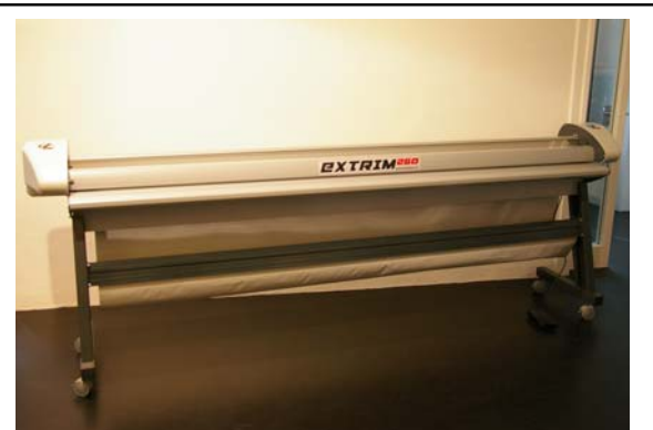
Vorführgerät aus Demoraum FLEXA Extrim 260 , el. Rollenschneider, max. Arbeitsbreite 2,6m, Bj. 2012 Technische Daten (Details bitte anfragen) Neupreis: € 3.800,- Verkaufspreis: € 3.249,-

Alle unsere Demomaschinen sind technisch überprüft und in einem einwandfreien, neuwertigen Zustand. Die meisten Geräte werden mit der vollen Hersteller-Garantie ausgeliefert (ausgenommen hiervon sind z.B. Verschleißteile wie Haupt- und Zugwalzen sowie Messer und Druckköpfe). Zwischenverkauf vorbehalten. Alle Preise sind in Euro und gelten EXW ab Lager Freiburg, zzgl. der gesetzlichen MwSt. Gerne unterbreiten wir Ihnen ein Angebot für die Anlieferung, Inbetriebnahme und Schulung des Personals.