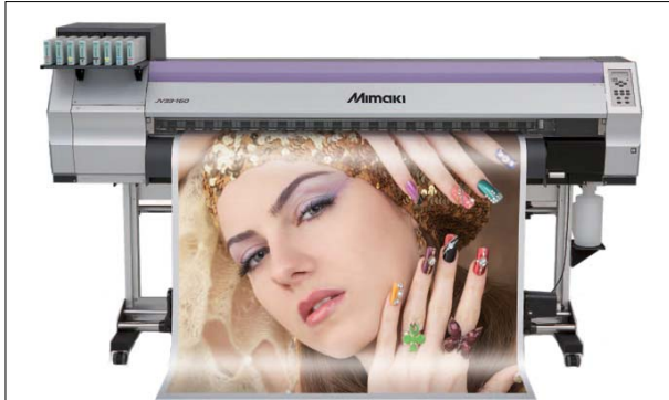
Vorführgerät aus Demoraum Mimaki JV33-160 , max. Druckbreite 1.615mm, inkl. 30 kg-Aufwicklung Bj. 2012 Technische Daten ( bitte hier klicken ) Neupreis: € 15.800,- Verkaufspreis: € 13.900,-