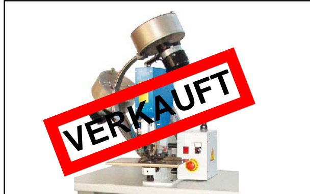
Neugerät aus Demoraum Robocop Junior , Ösenstanzautomat, für 12mm Metalllösen, ohne Tisch, Bj. 2013 Technische Daten (Details bitte anfragen) Neupreis: € 7.450,- Verkaufspreis: € 6.950,-