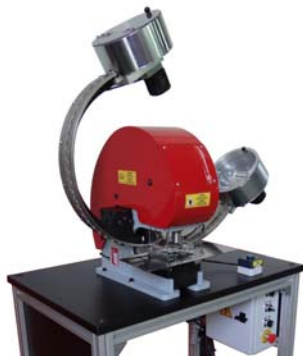
Vorführgerät aus Demoraum Bullet Ösenstanzautomat , inkl. Tisch und Werkzeug für 12mm für Kunststoffösen, Bj. 2011 Technische Daten (Details bitte anfragen) Neupreis: € 7.990,- Verkaufspreis: € 6.500,-