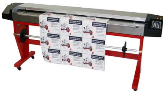
Vorführgerät aus Demoraum FOTOBA Digitrim 64 , automatisches Schnei- desystem für Rollen- und Bogenware von 200mm bis 1.600mm, Bj. 2011 Technische Daten ( bitte hier klicken ) Neupreis: € 14.500,- Verkaufspreis: € 11.500,-