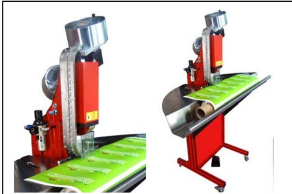
Vorführgerät aus Demoraum Rocket 2.0 Ösenstanzautomat , Boden- und Standgerät in einem, für 12mm Kunststoff-ösen, inkl. Werkzeug und Wanne, Bj. 2012 Technische Daten (Details bitte anfragen) Neupreis: € 5.990,- Verkaufspreis: € 4.990,-