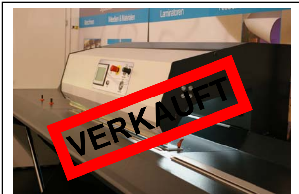
Vorführgerät aus Demoraum Apollo 155 Impuls Schweißmaschine , Arbeitsbreite 1.500mm, Ablagetisch mit Seitenverlängerung bis 5,9 Meter, Bj. 2011 Technische Daten ( bitte hier klicken ) Neupreis: € 16.500,- Verkaufspreis: € 12.500,-