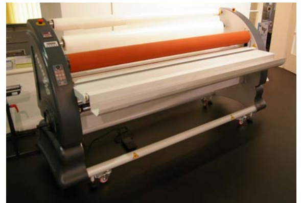
Vorführgerät aus Demoraum FLEXA Formula 210 Rollenlaminator , max. Arbeitsbreite 2,1m, obere Walze beheizbar, el. Walzenverstellung, u.v.m., Bj. 2011 Technische Daten (Details bitte anfragen) Neupreis: € 23.000,- Verkaufspreis: € 19.900,-