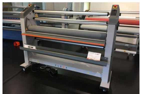
Vorführmaschine Flexa Easy Lite 160 Rollenlaminator, 1.600mm, Bj. 01/2018 Technische Daten: ( bitte hier klicken ) Neupreis: € 6.885,- Verkaufspreis: € 5.990,-

Alle unsere Vorführ- und Gebrauchtmaschinen sind technisch überprüft und in einem einwandfreien, neuwertigen Zustand . Die meisten Geräte werden mit der vollen Hersteller-Garantie ausgeliefert. (ausgenommen hiervon sind z.B. Verschleißteile wie Walzen sowie Messer usw.). Zwischenverkauf vorbehalten.