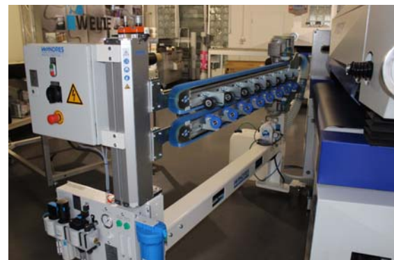
Gebrauchtmaschine Wandres Micro-Cleaning 1600 komplett 1.600mm Reinigungsbreite, Kombi Schwertbürste beidseitig, inkl. Untergestell Erstinstallation: 08/2016 Technische Daten: (Details bitte anfragen) Verkaufspreis: auf Anfrage

Alle unsere Vorführ- und Gebrauchtmaschinen sind technisch überprüft und in einem einwandfreien, neuwertigen Zustand . Die meisten Geräte werden mit der vollen Hersteller-Garantie ausgeliefert. (ausgenommen hiervon sind z.B. Verschleißteile wie Walzen sowie Messer usw.). Zwischenverkauf vorbehalten.