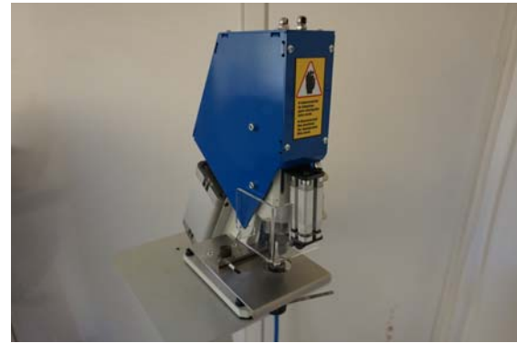
Vorführmaschine Junior pneumatische Ösenstanze inkl. Standfuß für Metall- und Kunststoffösen, Werkzeug- und Ösen-Größe wählbar, Bj. 04/2017 Technische Daten: (Details bitte anfragen) Neupreis: € 2.165,- Verkaufspreis: € 1.850,-