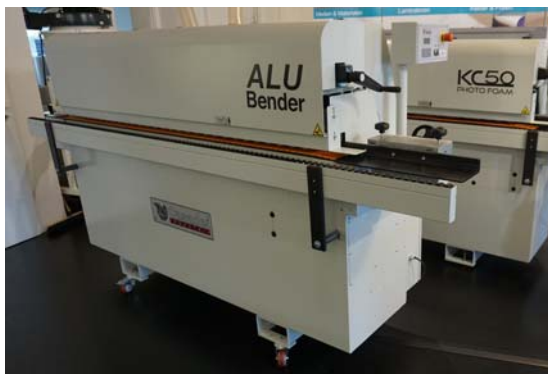
Vorführmaschine Casadei AluBender automatische Fräs- und Biegemaschine mit Kettentransport für Hartfasersubstrate und Aluminium Verbundplatten, HPL Resopal und Alu Wabenplatten, Bj. 2016 Technische Daten: (Details bitte anfragen) Neupreis: € 23.830,- Verkaufspreis: € 17.990,-