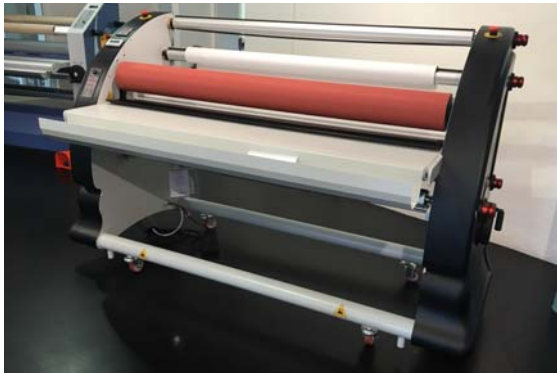
Vorführmaschine Flexa Formula 160 Rollenlaminator, 1.600mm, Vollausstattung, u.a. elektr. Walzenhöhenverstellung, obere Walze bis 140° C beheizbar, Bj. 01/2017 Technische Daten: ( bitte hier klicken ) Neupreis: € 17.265,- Verkaufspreis: € 12.990,-