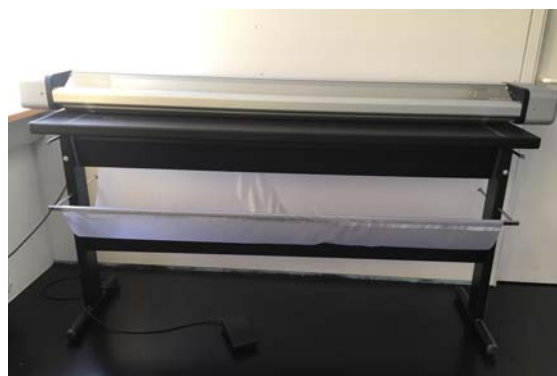
Gebrauchtmaschine Neolt Elektro Trim 150 Rollenschneidegerät für flexible Materialien, Schneidebreite 1.500mm, ohne optionalen Rollenhalter, einfache Bedienung, Bj. 2017 Technische Daten: (Details bitte anfragen) Neupreis: € 1.730,- Verkaufspreis: € 1.000,-