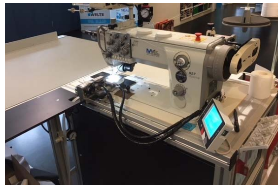
Vorführmaschine Matic Cronos Ultimate automatischer Nähautomat, Nadelabstand 6,4mm, Ausrüstung für Flachkeder / Flauschband, Bj. 07/2018 Technische Daten: (Details bitte anfragen) Neupreis: € 33.500,- Verkaufspreis: €31.500,-