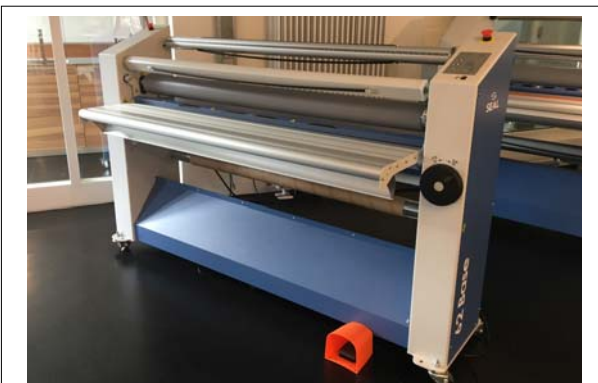
Vorführmaschine Seal 62 Base inkl. optionaler Aufwicklung Rollenlaminator, 1.600mm, Bj.: 06/2018 Technische Daten: ( bitte hier klicken ) Neupreis: € 11.390,- Verkaufspreis: €8.990,-