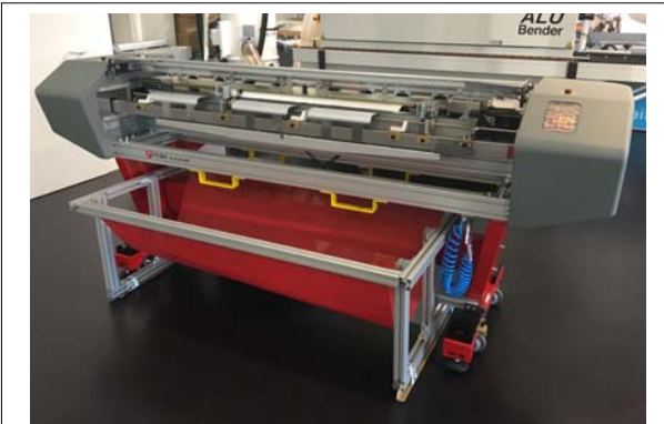
Vorführmaschine Fotoba XLD 170 WP vollautomatische XY-Schneidemaschine für das passgenaue Schneiden von Tapeten die auf Stoß verklebt werden, Bj. 03/2018 Technische Daten: ( bitte hier klicken ) Neupreis: € 40.000,- Verkaufspreis: €35.900,-