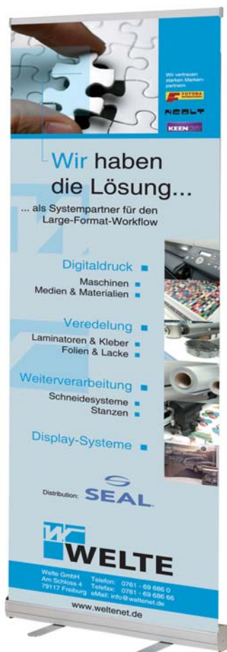
WP Eco Rolldisplay